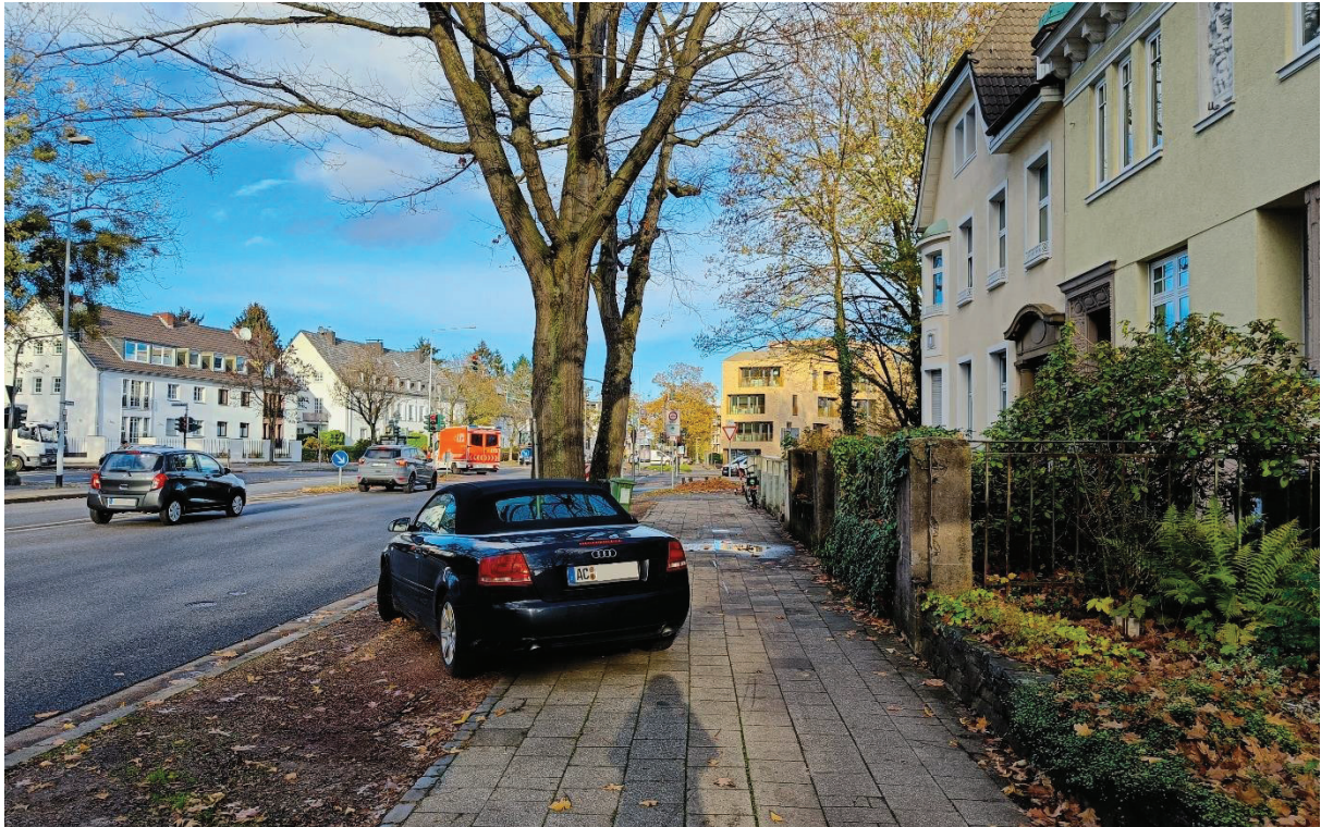
Unsauber abgestellte Fahrzeuge engen im Bestand an dieser Stelle regelmäßig den Gehweg ein.