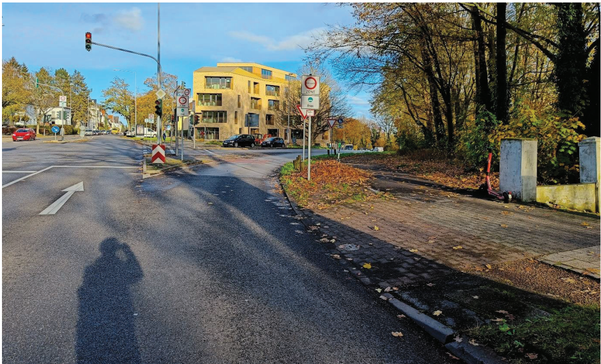
Verhältnismäßig gute Sichtbedingungen am freien Rechtsabbiegefahrstreifen in die Hohenstaufenallee, an dem der Radverkehr rechtwinklig und vorfahrtberechtigt quert.